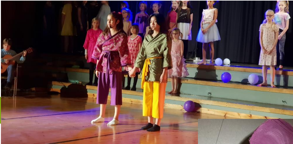
Luumunkukka ja Lohikäärme kuvat Minna-Maria Pesonen.